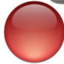
FAR INFRA RED