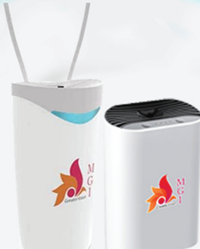
MGI Negative Ion Generator PERSONAL