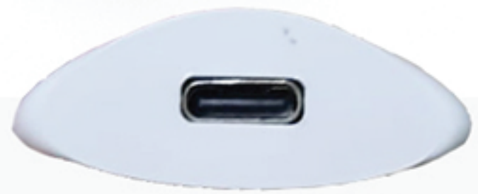
Colokan pengisian Tipe-E