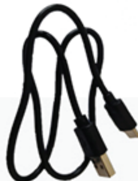
Kabel pengisian Tipe-C